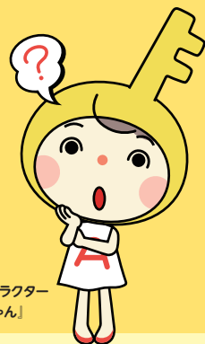
イメージキャラクター 「きいちゃん」

近年、新しいタイプの食物アレルギー「食物蛋白誘発胃腸炎（FPIES）」が急増しています。特に乳幼児に多く見られ、医療従事者を含めた社会的認知度の向上が求められています。この講演会では、最新情報とともに病気の特徴や対応方法等、臨床研究の最前線にいる専門医から分かりやすく解説します。