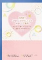
流死産の方へのパンフレット