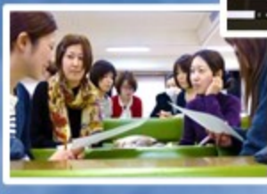
各種のグループワーク