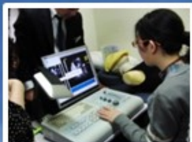
超音波シミュレーター