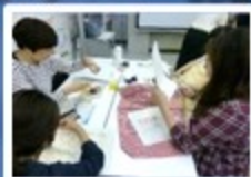
グリーンケア センター リビングケア