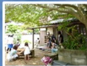
子育て広場で学ぶ