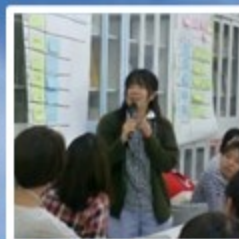
妊娠中からの虐待予防