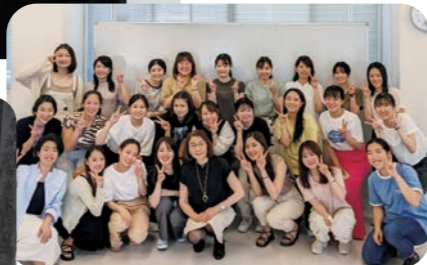
実習に臨む前の学生達と一緒に