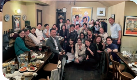
コロナと闘った仲間達とお疲れ様会