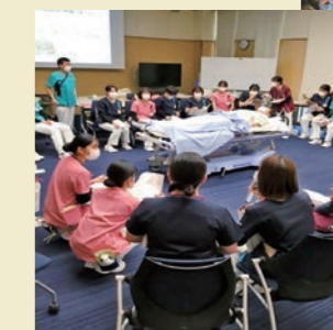
専門分野に特化した勉強会