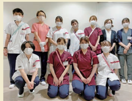
日動(白)・夜動(エンジ)でユニフォームを色分け

当院は、JR蒲田駅の西口にある180床のケアミックス病院です。急性期から慢性期までさまざまな病期の患者さんに看護を提供しています。循環器科を中心とした救急の受け入れを24時間365日行っており、東京都CCUネットワークにも加盟しています。今年度、看護部では働き方改革に力を入れています。この4月よりワークライフバランス実現のため、ユニフォームの勤務帯色分けを実施しました。情報収集のための前残業など古くからある慣習をなくす取り組みも進めています。また、清潔感を保つ身だしなみと責任をもって役割を果たすことを条件に、髪色の指定をなくしました。時代の流れに合わせ、今までの当たり前前に縛られず、意見をどんどん取り入れて、スタッフが明るく元気に働ける職場を目指しています。