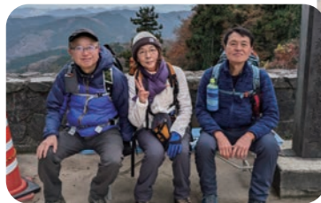
趣味の山登りの仲間と

助産師学校の校長として、管理・マネジメントをしています。「助産師＝お産の介助」と思って志しましたが、いざ学んでみると、この仕事の奥深さに感激しました。助産師に限らず、仕事は続けることが大事だと感じます。助産師としての誇りや責任感も、続けることで培われていくのだと思います。人間関係も同じです。皆さんも、上司や同僚、患者さんとのコミュニケーションに悩むことがあるかもしれません。でも、上手じゃなくていいんです。技術ではなく、ただ向き合い、話を聞くこと。今はダメでも、ある日突然わかり合えることもあります。人との深い関わりを、簡単に諦めて欲しくないですね。