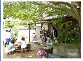
子育て広場で学ぶ