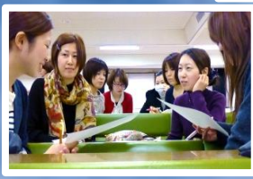
各種のグループワーク