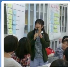
妊娠中からの虐待予防