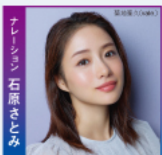
ナレーション 石原さとみ